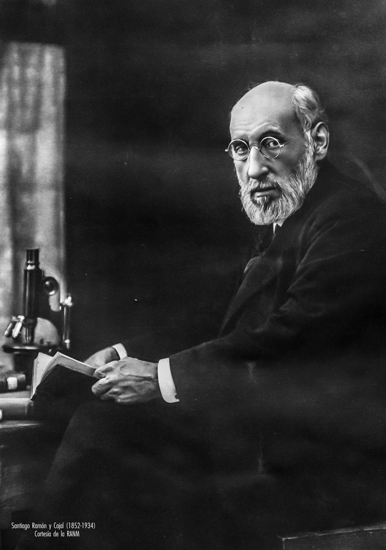
Santiago Ramón y Cajal (1852-1934)