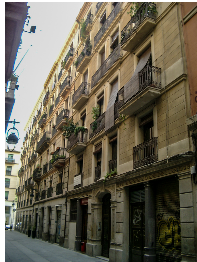
Edificio barcelonés de la calle del Notariado nº 7, hoy llamada del Notariat , donde Cajal alumbró en 1888 la teoría de la neurona. La vivienda que hay justo encima de los balcones con las persianas echadas tiene unos 90 m 2 y en ella habitó el sabio y su familia

Un sexto capítulo es el dedicado a las cartas cruzadas con diversas instituciones en las que se muestra que nuestro protagonista no descuidó las relaciones con lo que hoy llamaríamos la sociedad civil, especialmente cuando aquellas le habían hecho algún favor o le rendían homenaje, pues nuestro hombre fue siempre un gran reconecedor de los méritos ajenos. Es el patriotismo del gran científico el que está detrás de todo este trájín, como lo muestra su discurso en la entrega del Premio Echeagaray (1922), que como otras distinciones y monumentos que se le dedicaron, no le hacía mucha gracia porque le apartaba de su trabajo esencial: