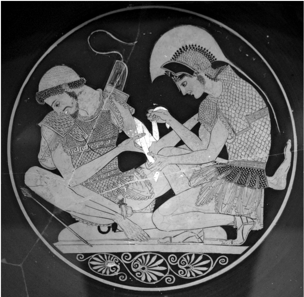
Figura 2. Escena pintada en el fondo de un kílix de figuras rojas (c. 500 a.C.), que representa a Aquiles vendando el brazo izquierdo de su compañero de armas Patroclo, herido por una flecha. Aunque invencible en el campo de batalla, Aquiles, a juzgar por la expresión del paciente y su inhabilidad para hacer coincidir los dos extremos de la venda, no parece revelarse como un diestro cirujano.

compañía. Las inscripciones citan en mil parajes los frumentarii y los pecuarii , encargados de la manutención y del parque de ganados; los librarii , tenedores de libros, y los leaticarii o enterradores. Estas corporaciones tenían sus jefes, sus reglamentos, sus privilegios; todos los miembros eran solidarios; no se admitía a nadie en ellas sino por medio de exámenes; cada una tenía una oficina o centro, schola , lugar de reunión donde se trataban los asuntos comunes.