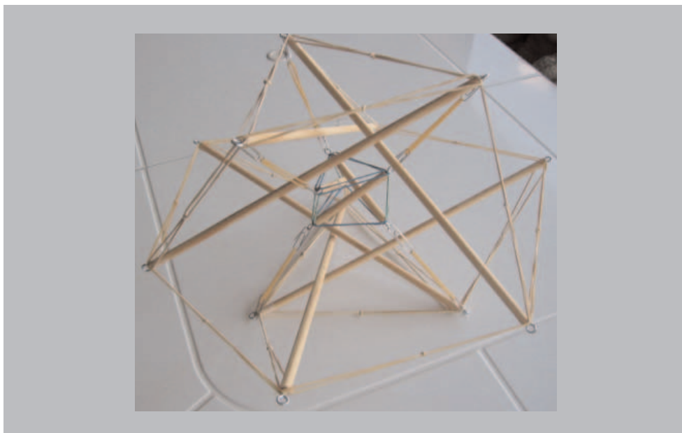
Figura 3. Modelo de la célula.

La tensegridad total así construida modeliza la célula. Dentro de ella la tensegridad pequeña hace el oficio del núcleo. La forma del núcleo varía al alargar la célula en una dirección como sucede en nuestro modelo. Si el modelo se coloca sobre un cristal y se presiona la parte superior, entonces su núcleo se aplana y se extiende también. Y cuando la presión mengua, la célula y el núcleo vuelven a su posición estable. Y todo ello debido a las propias conexiones internas de todo el entramado.