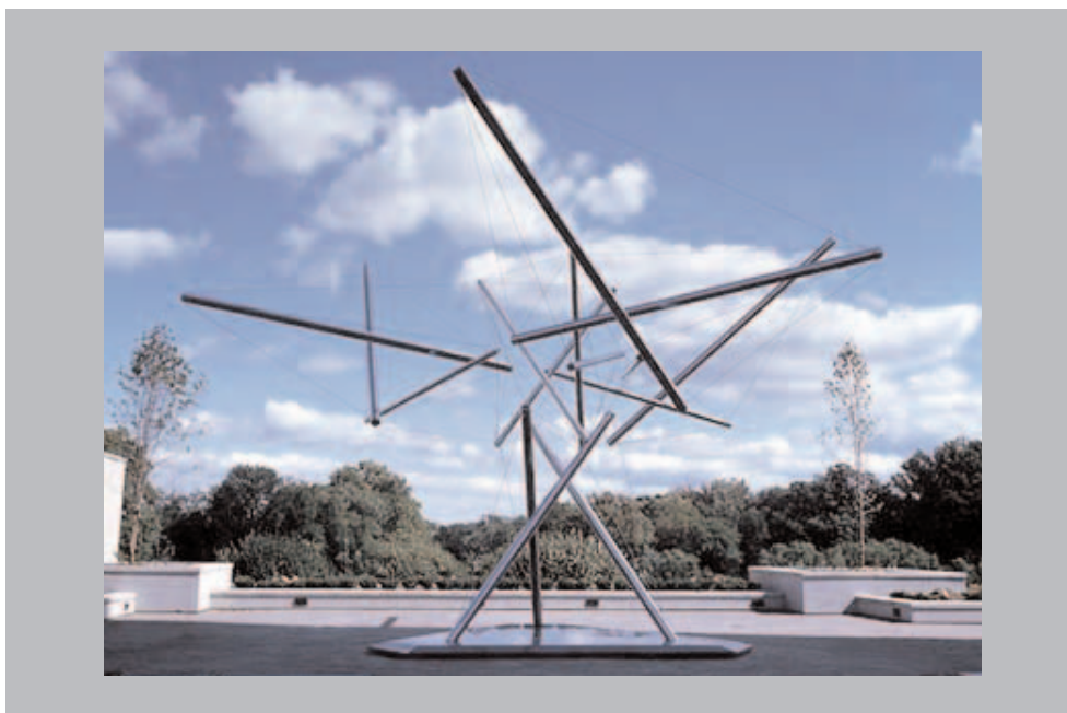
Figura 2. http://www.kennethnelson.net/sculpture/outdoor/3.htm

La imagen de la tensegridad que hemos descrito (prisma oblicuo de base triangular) proporciona una idea muy pobre. Para saborear más plenamente su belleza lo mejor es fabricarse un modelo uno mismo. Hacerlo con elementos caseros no es nada difícil. Tomamos tres bolígrafos de los que desechamos la parte interior, seis hembrillas de las que se usan para colgar cuadros y que introducimos en los extremos de los bolígrafos (se pueden usar pequeños tacos para ajustarlas) y unas cuantas sencillas anillas de goma que van a hacer el oficio de cables. Viene bien, para sostener la estructura mientras la construimos, un tubo cilíndrico de cartón, como por ejemplo el tubo interior de un rollo de papel de cocina.