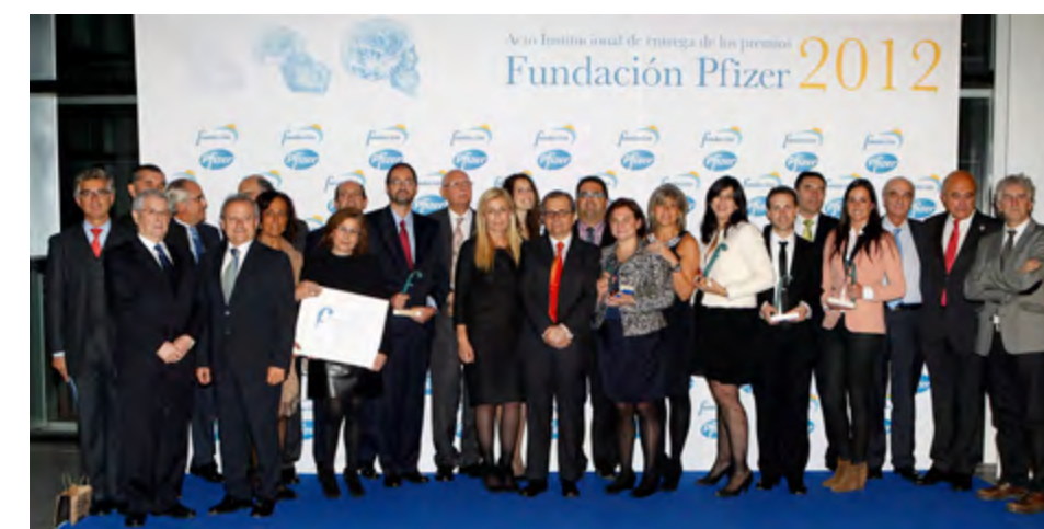
Los premiados junto con el Patronato de la Fundación Pfizer y las autoridades que presidieron el acto.