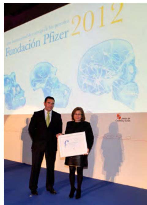
Mención Especial: 'Tengo cáncer y jugando... aprendo a cuidarme', de la Asociación Infantil Oncológica de la Comunidad de Madrid.