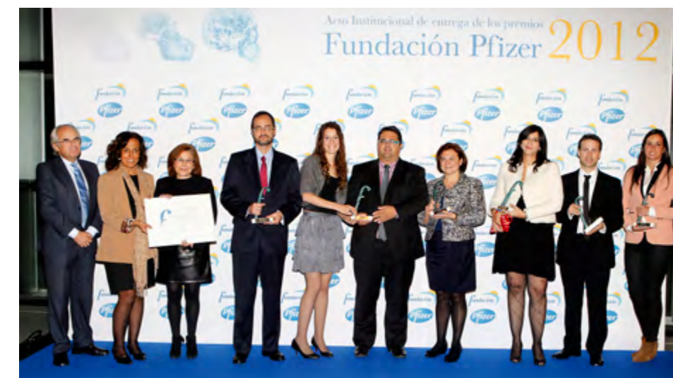
Galardonados en los Premios Fundación Pfizer 2012.

El acto tuvo un elevado número de asistentes, superando las expectativas, aproximadamente 255 y 73 impactos en medios de comunicación.