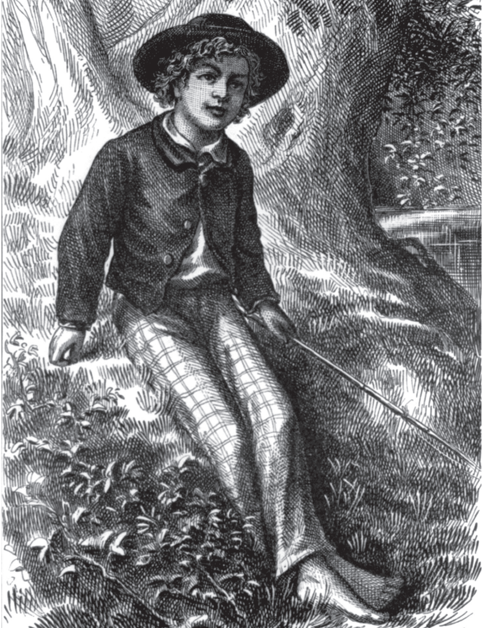
Tom Sawyer pescando, imagen tomada de la primera edición (1876) de The Adventures of Tom Sawyer (autor desconocido).